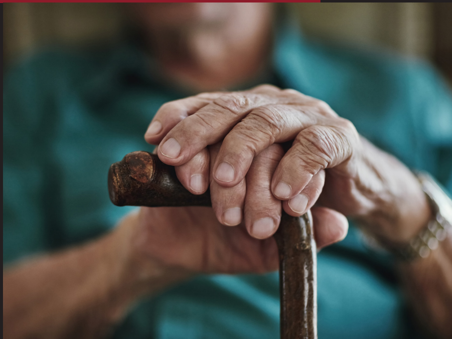
Photo recadrée d'un homme, qu'il n'est pas possible de reconnaître, s'appuyant sur sa canne.